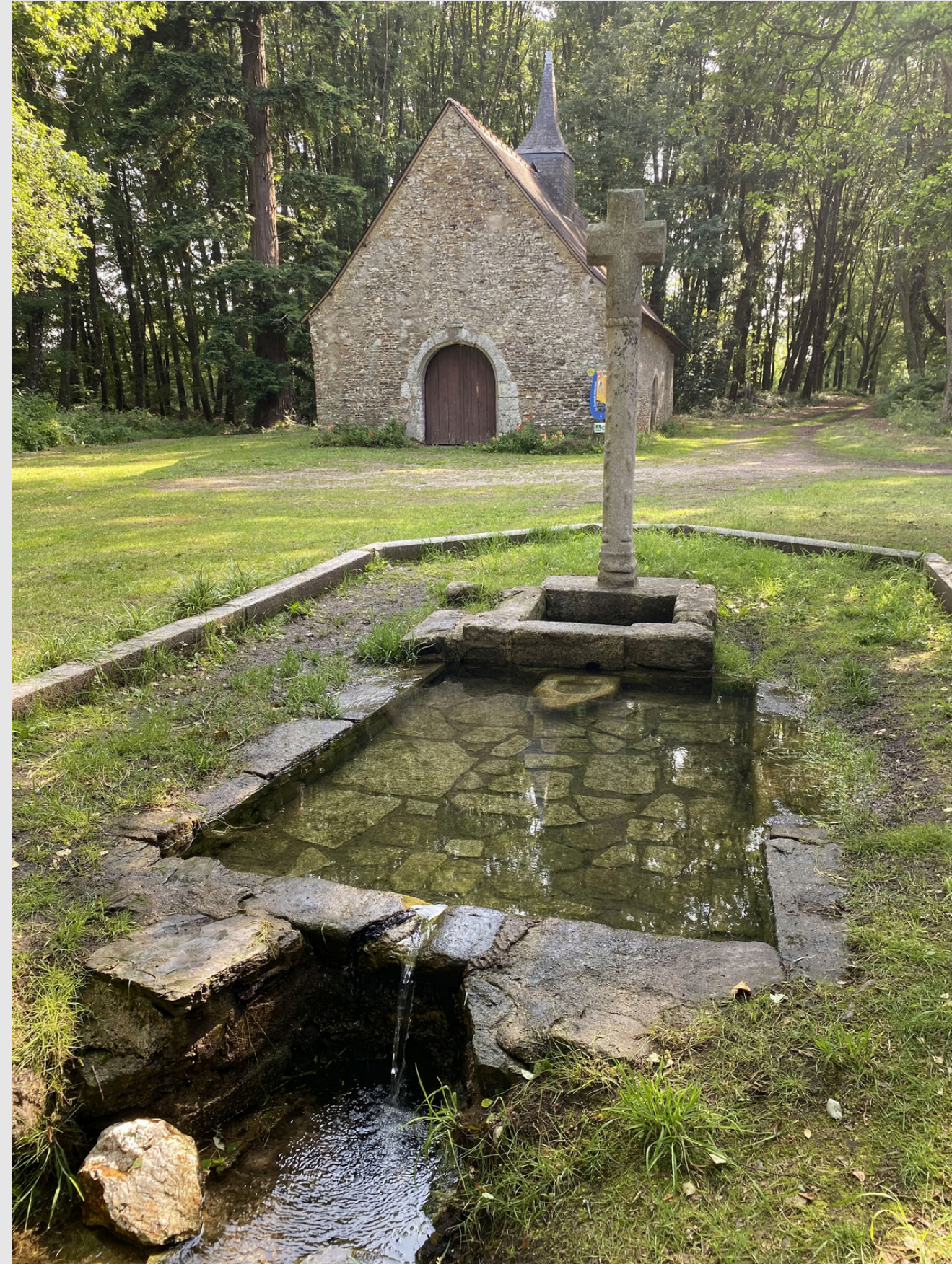
Croix de la chapelle Saint-Marc, Mohon, vue ouest